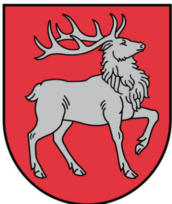
1. attēls. Latviešu vēsturiskās zemes Sēlijas ģerbonis — sarkanā laukā pretēji pagriezts ejošs sudraba staltbriedis 3